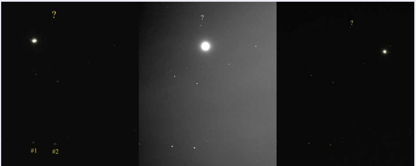
Figure 4 • Quelques photographiques de l'auteur : a) 11 sept. 2010 ; b) 21 sept. 2010 (remarquez l'effet de la présence de la pleine Lune!) ; c) 5 oct. 2011. Jupiter est l'objet brillant, alors que l'objet inconnu (?) fut à découvrir : il y avait au même moment l'opposition d'Uranus!

permettra d'obtenir une image empilée ( stack ) finale nette et lumineuse pour votre planète et les étoiles. On dit alors que le rapport signal/bruit est bon.