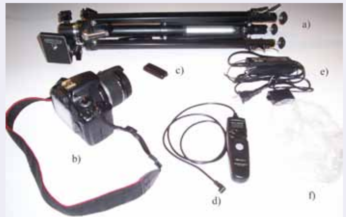
Figure 3 • Matériel utilisé par l'auteur lors de l'opposition de Jupiter de septembre 2010 : a) trépied ; b) appareil DSLR ; c) déclencheur à distance ; d) intervalomètre « Timer Remote Control » ; e) adaptateur AC pour ACK-E5 ; f) bonnet de douche pour protéger l'appareil de la rosée. Au moment d'écrire ce texte, l'auteur attendait la « Silicone Skin » pour son appareil.

voir les étoiles dans le champ de visée. Le détecteur de votre appareil numérique est beaucoup plus sensible que votre œil : il captera toute la lumière provenant du ciel !